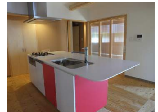
オープンキッチン