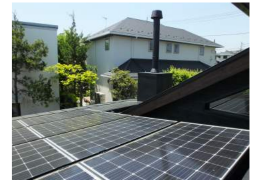
太陽光発電パネル