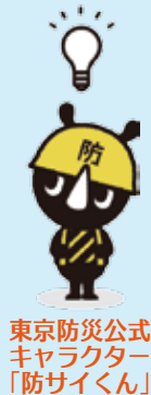
東京防災公式キャラクター「防サイくん」