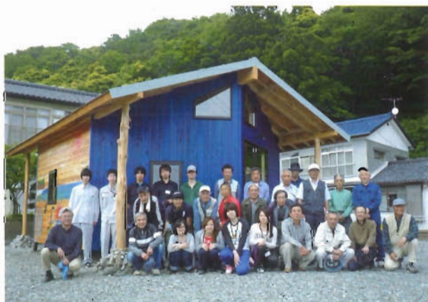
いわき市豊間地区連絡所兼復興協議会事務所