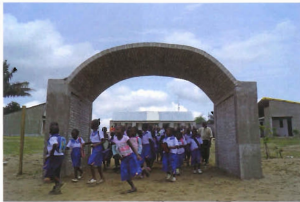
コンゴ民主共和国キンシャサ、アカデックス小学校

共に、グローバルとローカルの3つのバランスについて説明された。それは①（材料）においては現地材を使うことの大切さ、②（構法）においては地元と日本、双方の技術を上手く使うこと、③（協働）においては、日本で事前にデザインすること、と現地においては現地の人と一緒に組み立てること、と説明した。