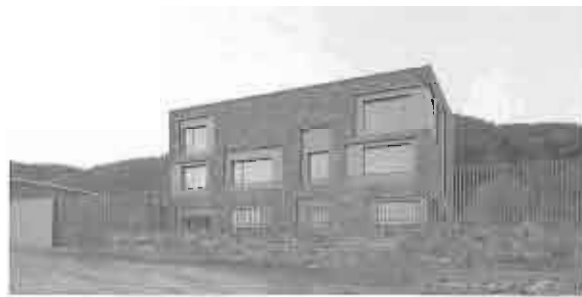
北京 Y house 外観