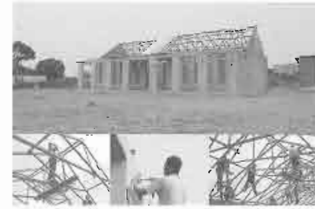
現地建材、現地人との協働によるプロセス