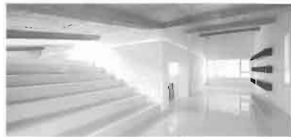
北京 Y house 内観